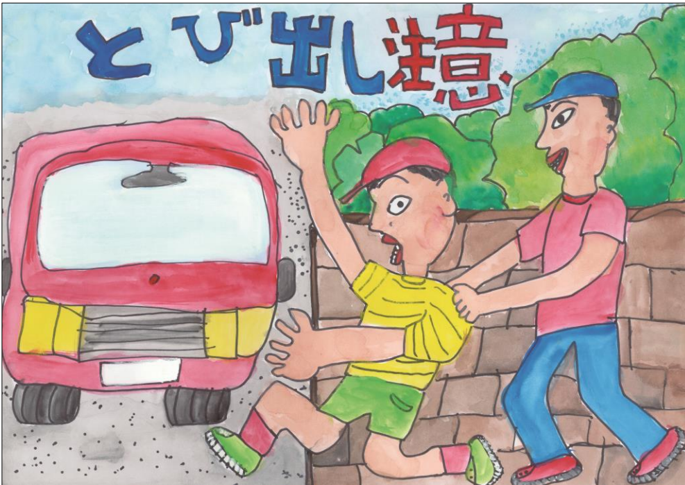
平成30年度 交通安全ポスターの部 豊田市議会議長賞作品