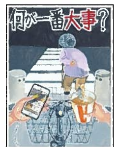
H30年度 豊田市長賞 作品