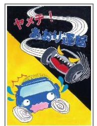
令和元年度 豊田市長賞作品

応募資格 豊田市在住又は在学・在勤の方 提出先 豊田市交通安全市民会議事務局(豊田市役所南庁舎4階 交通安全防犯課内) 提出方法 小学生、中学生及び高校生の応募者は学校を通じて応募してください。作品の裏面(作文は最終ページ)に、氏名、住所、電話番号、年齢を明記してください。 提出期限 令和3年9月6日(月) その他 詳しい応募要領は、豊田市交通安全市民会議HPをご参照ください。(HPアドレス https://signal.toyota.aichi.jp/ )