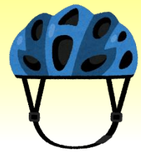
愛知県内自転車死者の負傷主部位構成率 (平成30年~令和4年 愛知県警統計資料)