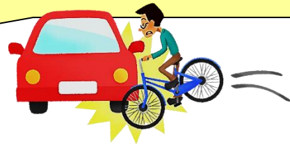
自転車用ヘルメット着用状況別致死率 (平成30年~令和4年 愛知県警統計資料)

ヘルメットを着用しないと キケン 自転車交通死亡事故で最も多い致命傷は「 頭部 」 で、全体の 7割以上 を占めています。