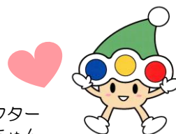
交通安全キャラクター シグナルちゃん