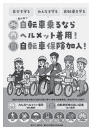
条例を周知するチラシ・ポスター

市が指定した自転車安全利用推進強化地区において、安全な利用の促進を図るため、啓発を重点的に行います。