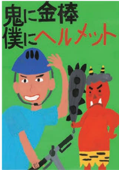
優秀／三浦 央輔 (浄水中1年)