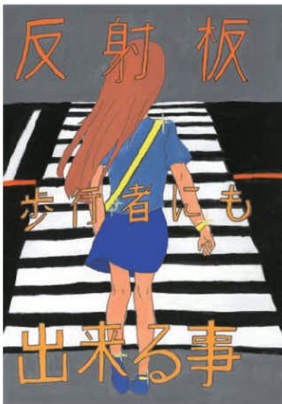
優秀／川合 杏 (末野原中2年)