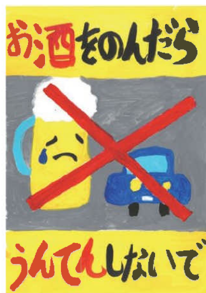
佳作／中川 陽菜乃 (朝日小3年)