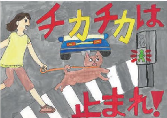
優秀／嶋村 詩織 (敷島小4年)