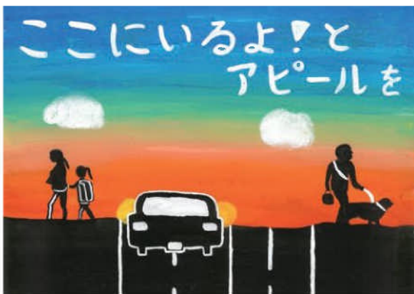
優秀／馬場 優愛 (高岡中3年)