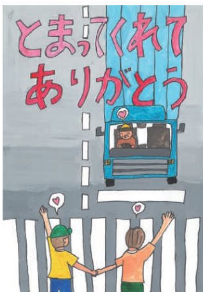
優秀／柘植 理玖 (幸海小5年)