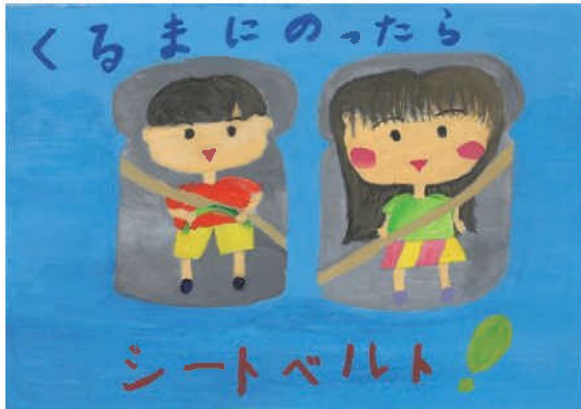
佳作／二宮 向葵 (寿恵野小1年)