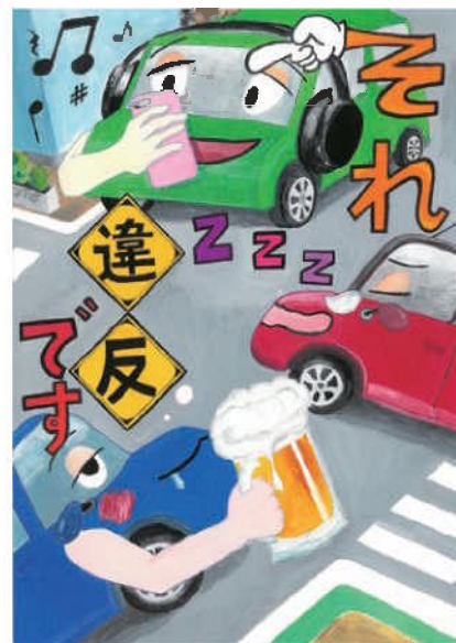
優秀／手嶋 美緒 (前林中2年)