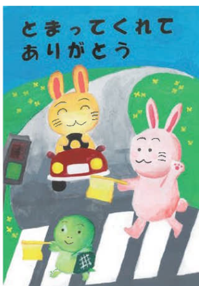
優秀／古賀 楓那 (浄水中1年)