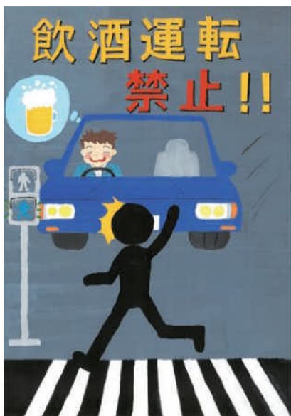
佳作／鷺尾 友崇 (浄水中1年)