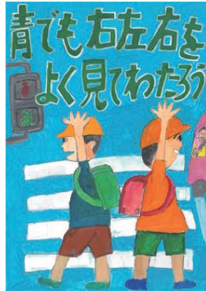
優秀／丸山 輝 (駒場小3年)