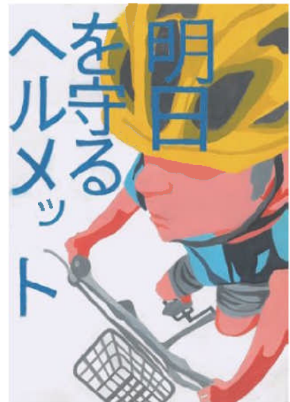
優秀／小笠原 紗英 (竜神中2年)