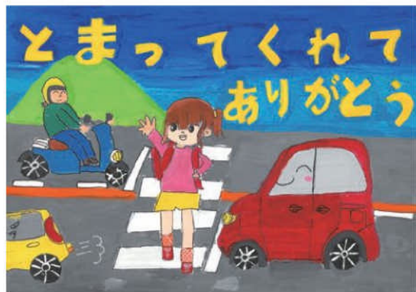
優秀／矢野 陽菜香 (浄水小4年)