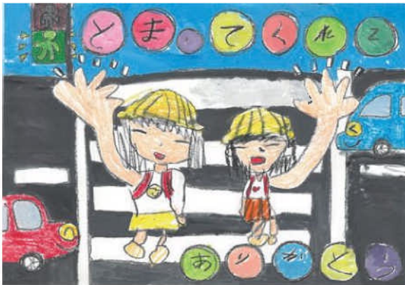
佳作／鹿野 奈那 (井上小2年)